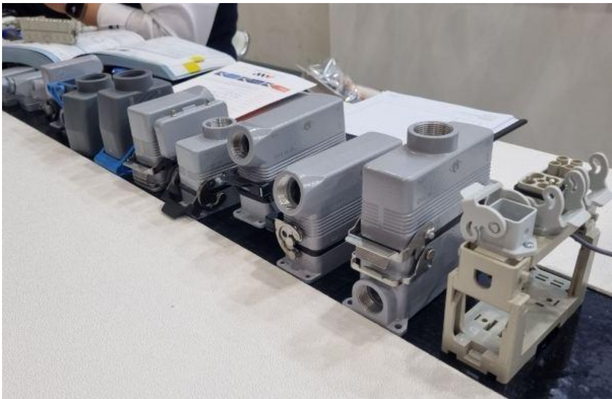
▲ 일메의 사각커넥터

이번 전시회에서 소개한 인서트-SQUICH SERIES 는 일메의 특허 기술 'SQUICH'이 적용돼 별도의 가구나 공구없이 결선을 보다 쉽게 할 수 있게 도와주면서 강하게 고정시켜준다. 공장 자동화 설비, 로봇 설비, 풍력 발전 설비, 철도 차량용 솔루션에 CX 05 SHF/SHM 가 적용될 수 있다. 푸시 버튼 적용으로 보다 간편하게 결선 및 유지보수 작업이 가능해져 강한 진동에 대한 대응력과 기구적인 피로대응이 개선되어 작동 오류를 해소한다.