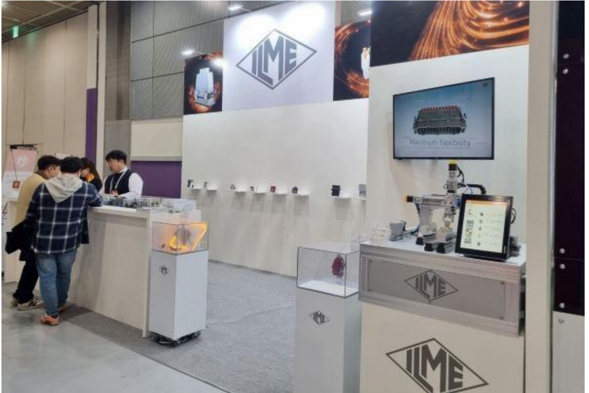
▲ AW 2023에 참가한 일메코리아

ILME(일메)코리아가 '스마트공장·자동화산업전 2023(Smart Factory+Automation World 2023, 이하 AW 2023)'에 참가해 산업용 사각 커넥터를 소개했다.