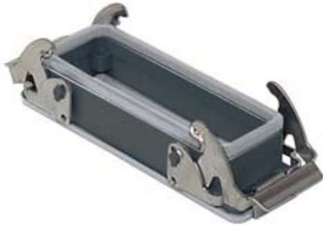
Anbaugehäuse, Gr.57.27, IP67 E-Xtreme, 2 Bügel